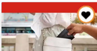
Pas op zakkenrollers: voork...