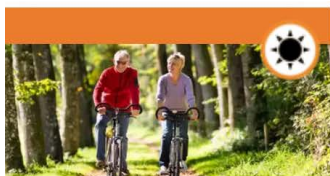
Fietsroutes app: de mooiste...

Een bezoek aan een kasteel is een boeiende reis door het verleden. Achter de poort van ieder kasteel speelden zich bijzondere taferelen af. Stoere ridders en schone jonkvrouwen hadden daarin de hoofdrol. Een kasteelwandeling brengt je door mooie plekken in de natuur. Maar ook bij een imposant kasteel. Dit zijn de zeven tips van grijsopreis.nl voor een bijzondere kasteelwandeling.