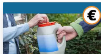
Goede doelen steunen: 5...